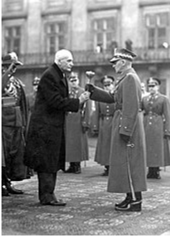
Präsident Ignacy Mościcki bei der Verleihung der Marschallwürde an General Edward Rydz-Śmigły