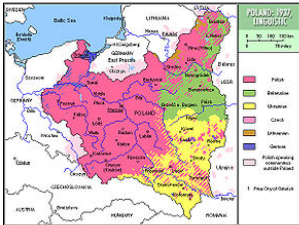
Polen, Sprachenkarte 1937 in einer polnischen Darstellung von 1928