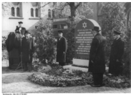
Einweihung des Ehrenmals für die jüdischen Opfer des Faschismus auf dem Jüdischen Friedhof Berlin-Weißensee, 11. Oktober 1953.

Als Ergebnis dieser Antisemitismuswelle wurden viele ostdeutsche Juden, ob gläubig oder säkularisiert, ihrer Positionen in Partei und Staat entbunden und in die erneute Emigration getrieben. Die repressive Politik gegenüber Juden änderte sich erst nach Stalins Tod 1953: