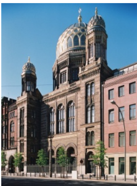
Neue Synagoge an der Oranienburger Straße in Berlin.

Den jüngeren ostdeutschen Generationen, die den Krieg nicht erlebt hatten, reichte die Geschichte zur antifaschistischen Vergangenheit ihrer politischen Führer nicht mehr aus, um deren Herrschaft in den 1980er-Jahren zu rechtfertigen. Just am 9. November 1989, genau ein Jahr nach jenen Gedenkfeiern zum 50. Jahrestag der Reichspogromnacht, mit denen die SED das antifaschistische Image der DDR zu stärken und ihre Herrschaft zu stabilisieren versucht hatte, fiel im Zuge des revolutionären Aufbegehrens der Ostdeutschen die Berliner Mauer.