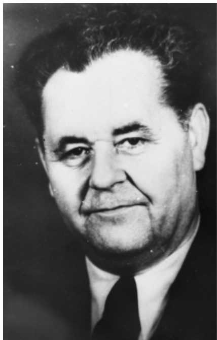
Paul Merker (1894-1969).

Das hatte auch Konsequenzen für die Innenpolitik. Um die "zionistischen Agenten des Weltjudentums" zu "enttarnen", initiierte Moskau zahlreiche Parteisäuberungsaktionen in Osteuropa. Die Opfer, wie der tschechoslowakische KP-Generalsekretär Rudolf Slansky, wurden des "bourgeois Kosmopolitismus", des Liberalismus oder der Spionage bezichtigt. Natürlich wirkten sich die Säuberungsaktionen auch auf die Politik der DDR aus, die sich den sowjetischen "Antizionismus" zu eigen machte und ihn in Verbindung mit dem Thema der Restitution für ihre Propaganda und Außenpolitik nutzte. Die Regierung Israels hatte schon früh auch von der DDR Entschädigungen für die NS-Verbrechen gefordert. Aber die SED war nicht gewillt, eine gesamtdeutsche Verantwortung für den Holocaust anzuerkennen.